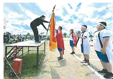
凜々しい姿の表彰式