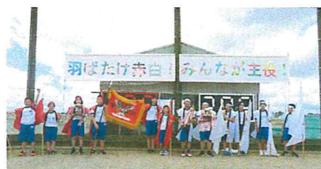
みんなで考えたスローガン