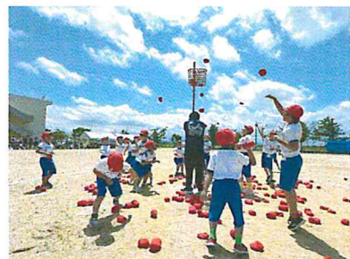
パーフェクト玉入れ