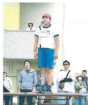
健闘をたたえ合う閉会宣言