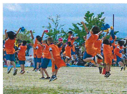
全校ダンス「タッタ」