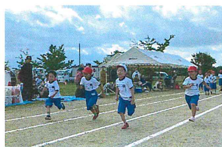
さあ！いくぞ！徒競走