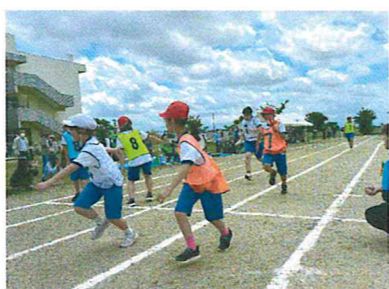
バトンをつなげ上学年リレー