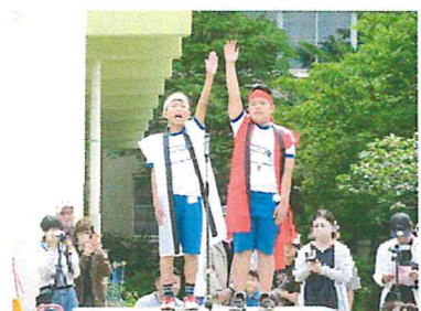
両組団長による「選手宣誓」