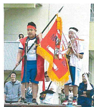
団長による感想発表